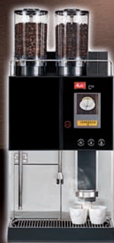
Melitta® c13 smart und schnell schlankweg mehr

Melitta SystemService www.melittasystemservice.de